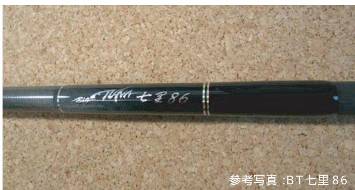
参考写真 : BT 七里 86