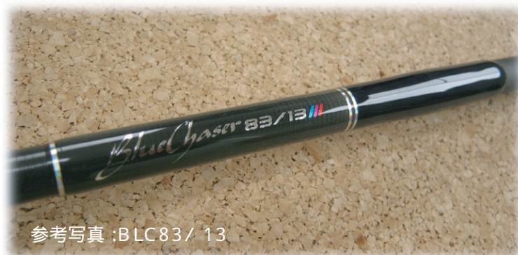
参考写真 : BLC83 / 13